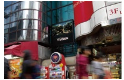
【Part2】エレベーターガラス面 (2F部分)